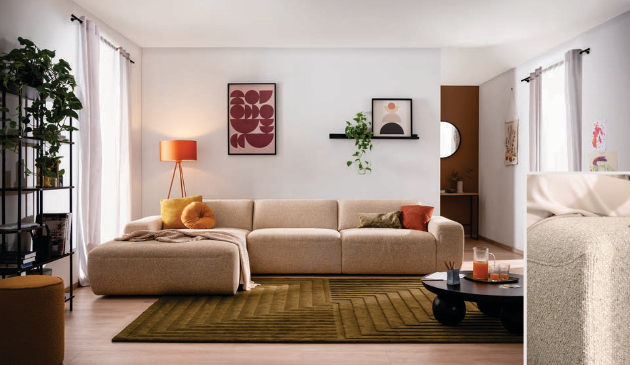
Weiches "Melodious Ivory", sanfte Formen und modulare Elemente: Sofa PINEA bringt Ruhe ins Zuhause.