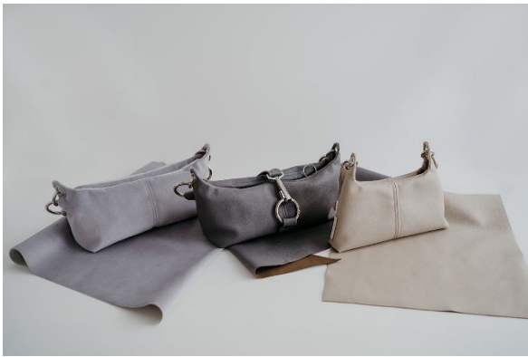
Upcycling by SABORKA: ADA bags für ein gutes Gewissen